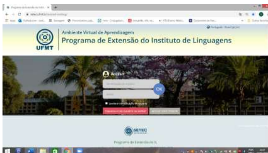
Página inicial da plataforma AVA do Programa de Línguas do IL